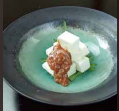
酒粕クリームチーズ