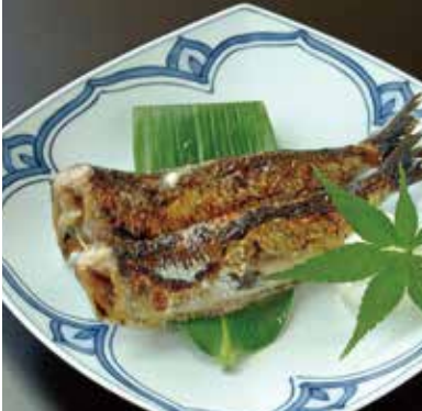
いわし越後漬焼き