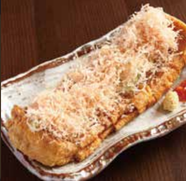
枋尾の油揚げ焼き