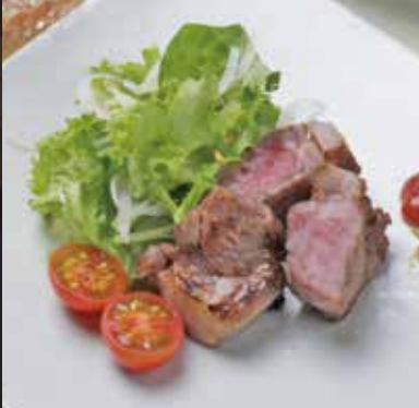
和牛ロース醤油焼き