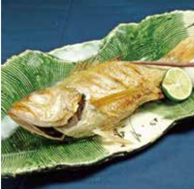
日本海のど黒塩焼き