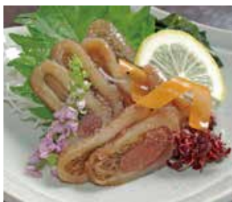
佐渡真いか沖漬け