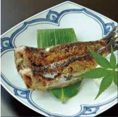
日本海のど黒塩焼き 時価