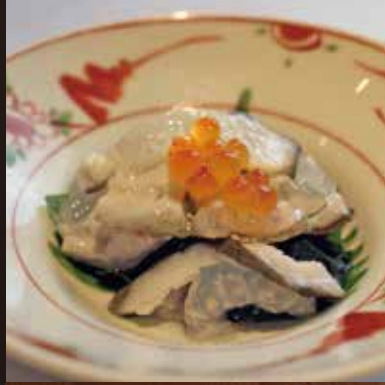
枋尾の油揚げ焼き 七五〇円 〜