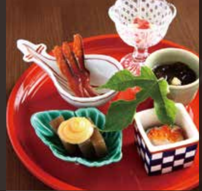
出汁巻き玉子 七五〇円