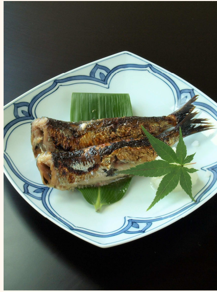
《二尾のイメージ写真》