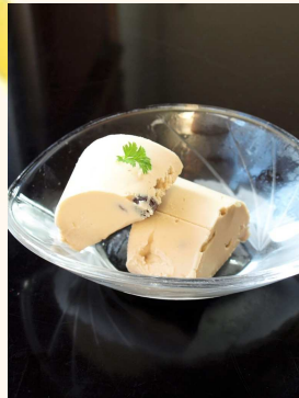
《写真は黒蜜大納言入り》