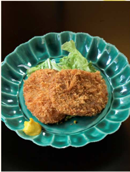
《二枚のイメージ写真》