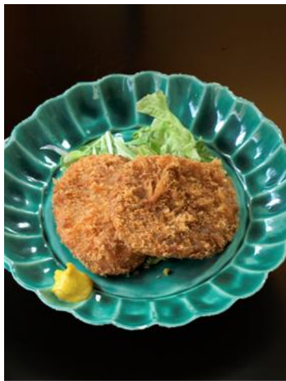
《二枚のイメージ写真》