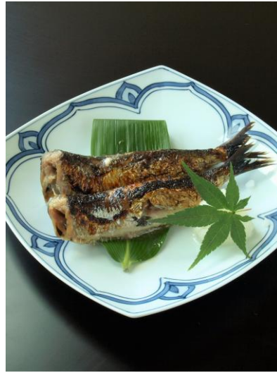
《二尾のイメージ写真》