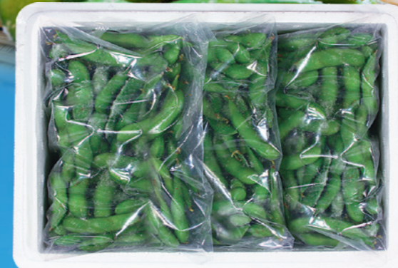
※セット画像はイメージです

新潟県長岡市にある農園にて栽培され出荷当日に収穫した枝豆をお届けいたします。たっぷり日光を浴びて、栄養を蓄えた枝豆を収穫後に大量の水で「5度以下」まで冷やすことで旨味をぎゅっと閉じ込めました。