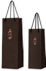
久保田専用手提げ袋