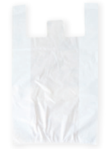
手提げビニール袋